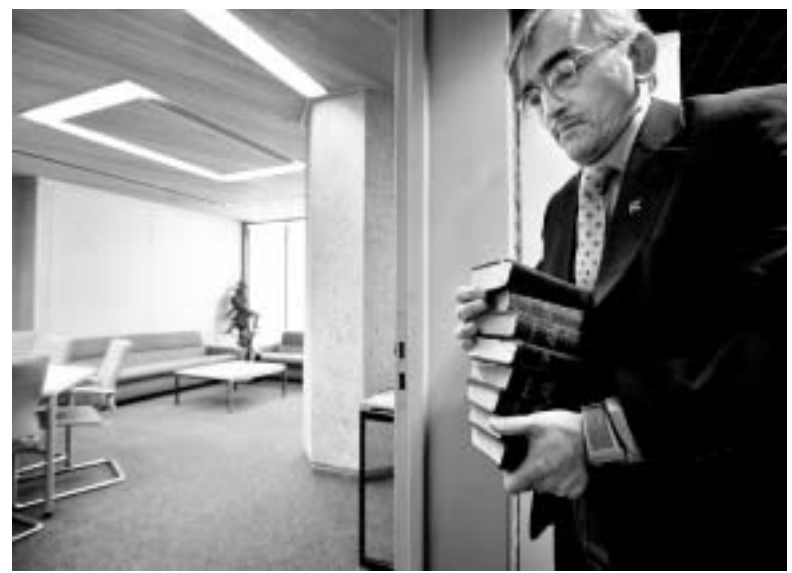
De gebedsruimte van het ministerie van buitenlandse zaken.