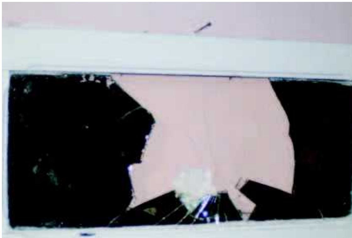
De gebroken spiegel uit de synagoge.

Volgens Spaans is het al het tweede geval in korte tijd dat hem ter ore kwam. “En ik verwacht dat dit soort dilemma’s zal toenemen.” Hij zegt te hopen dat de ChristenUnie haast maakt met een door de partij aangekondigde uitlokking van een principe-uitspraak van de rechter over biometrie. “Waarbij wellicht ook kan worden getoetst of biometrie nu wel of niet een schending is van de lichamelijke integriteit en onder de bescherming van artikel 11 van de Grondwet zou vallen.”