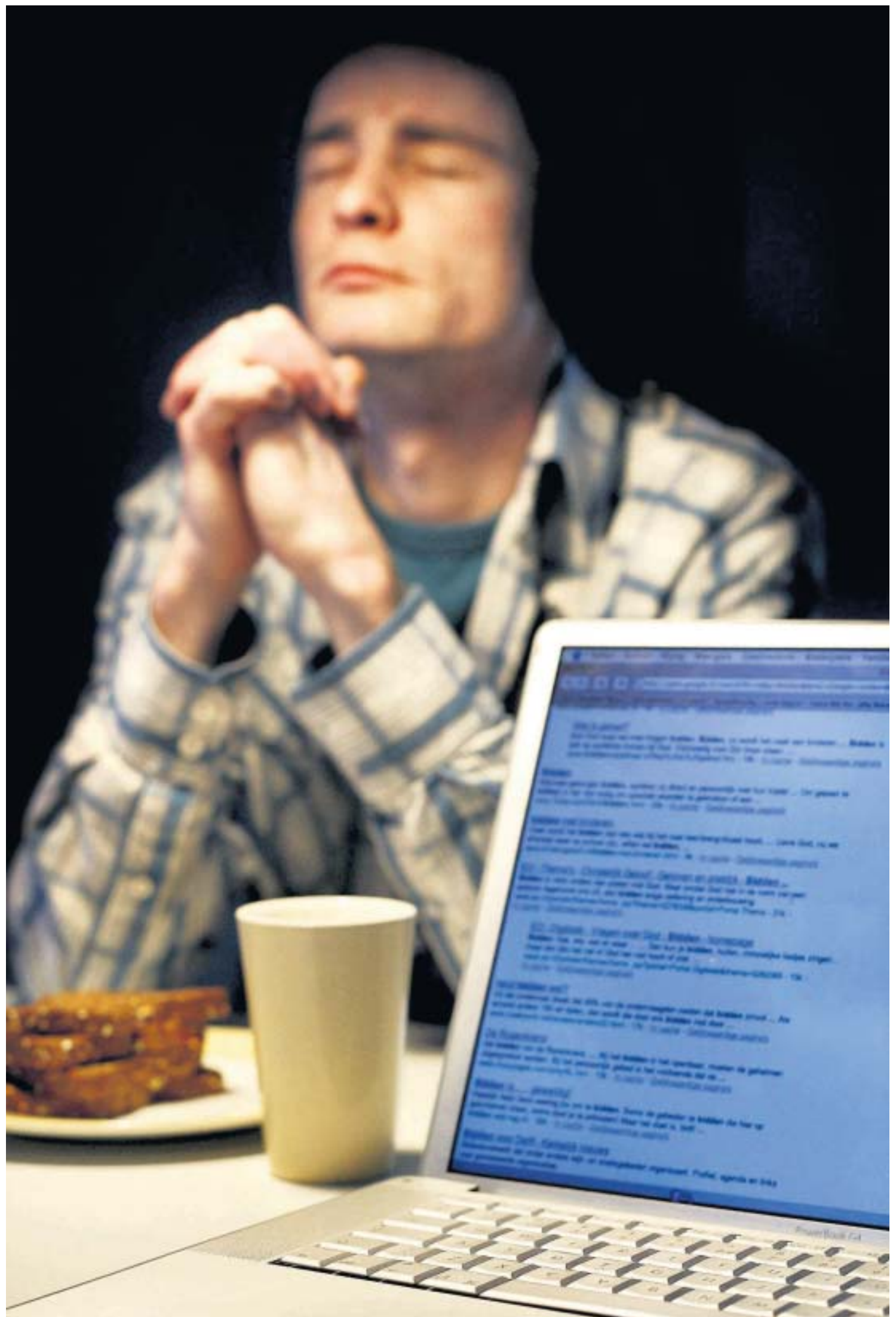
Bij meer dan tweehonderd bedrijven in ons land zoeken werknemers elkaar in de pauze op om te bidden.